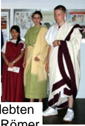
So lebten die Römer