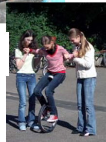
Einrad fahren in der Pause